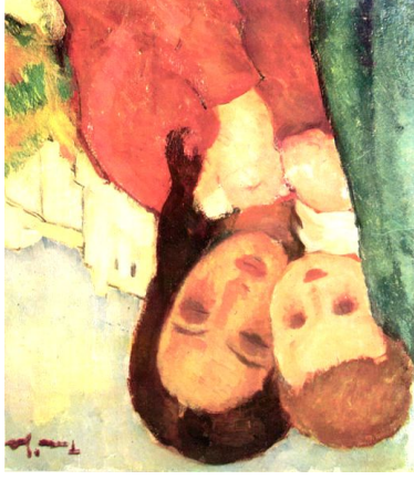
"Mama si copilul", by Nicolae Tonitza a Romanian painter

Și-n parfumul primăverii, Să-ți mai prind în păr o floare: Cu florul revederii, Și cu dor, o sărutare.